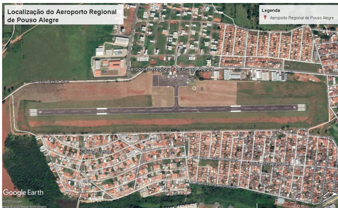
Figura 1 - Localização do Aeroporto Regional de Pouso Alegre

O aeródromo está dentro da Unidade Territorial de Planejamento (UTP) de Pouso Alegre, que compreende 25 municípios, dentre eles: Paraisópolis, Santa Rita de Caldas, Ipuiúna, Santa Rita do Sapucaí e Ouro Fino. Nessa UTP, somente Ouro Fino possui outro aeródromo, o que mostra a importância regional dessa edificação.